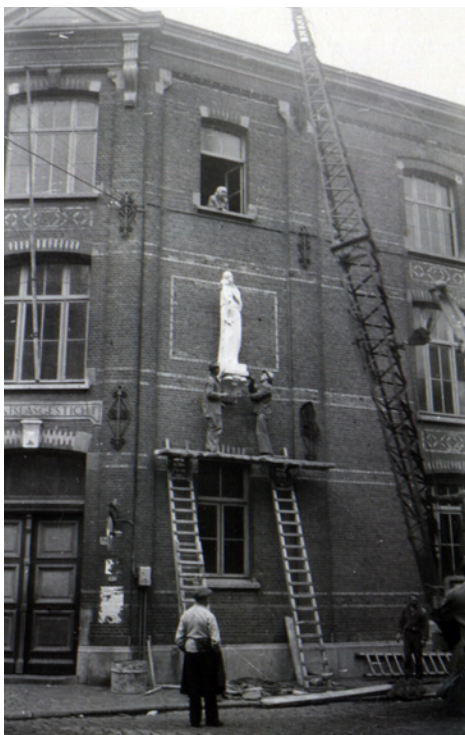
Plaatsing Mariabeeld (gevel Sint Stanislascollege)