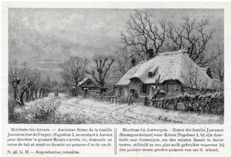
Postkaart met boerderij van boer Janssens langs de Boomgaardstraat