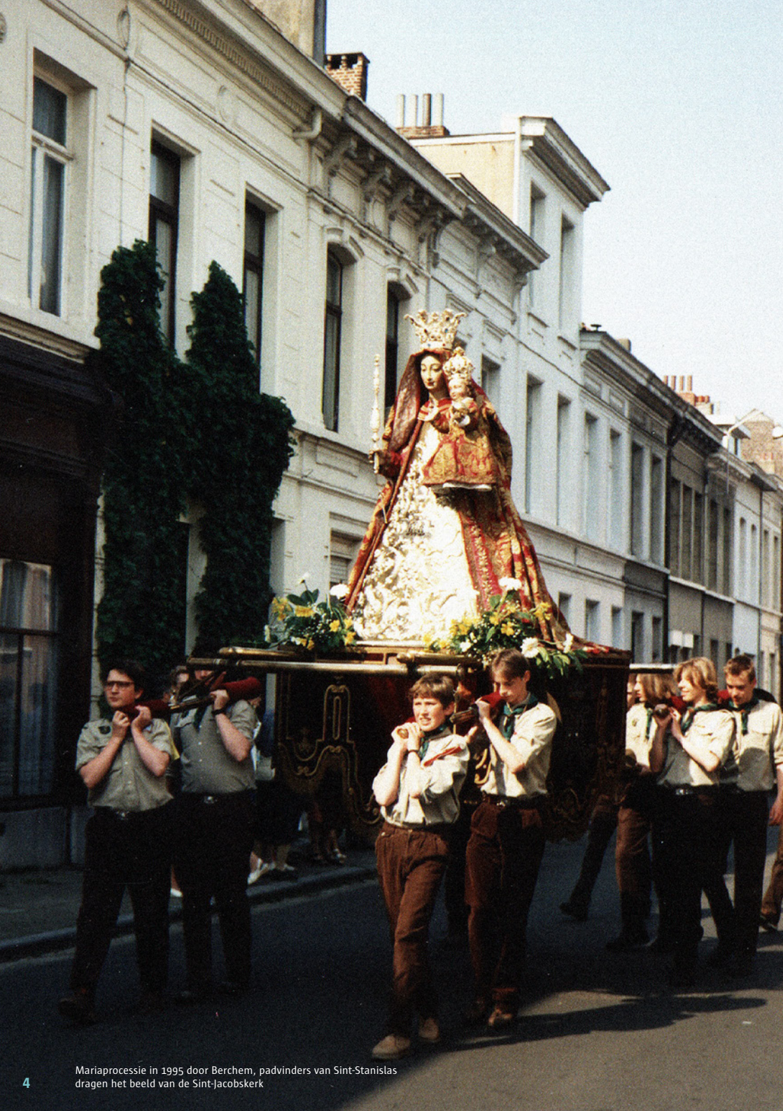
Mariaprocessie in 1995 door Berchem, padvindes van Sint-Stanislas dragen het beeld van de Sint-Jacobskerk

geplaatst. Ook de Sint-Willibrorduskerk beschikt over een prachtige Madonna van een broederschap die in 2018 voor de 224ste maal te voet naar het bedevaartsoord Scherpenheuvel ging. Wie goed kan tellen, weet dat de bedevaart de eerste keer plaats had tijdens de Franse Revolutie. In de 19de eeuw kennen we een katholiek reveil: terwijl er in 1800 in de Sint-Willibrorduskerk jaarlijks ongeveer vijftig kinderen worden gedoopt, zijn er dat vijfhonderd in 1900. Berchem wordt een gemeente van rijk en arm met een enorme bevolkingstoename. De rijken pronken met kunstig gebeeldhouwde beelden op de gevel van hun burgerwoning, terwijl de eenvoudige mensen het houden bij een houten kapelletje in hun steegje of straatje. Ook na periodes van cholera (1866) en oorlogen worden er heel wat beelden geplaatst uit dankbaarheid voor gezondheid en vrede.