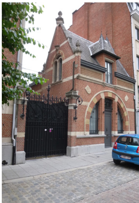
Koetsuitgang familie Meeüs