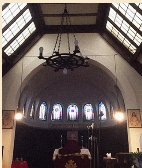
Interieur Kapel Cameliestraat 5