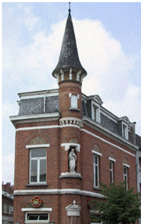
Mariabeeld in een nis (hoekhuis F. Van Hombeeckplein)