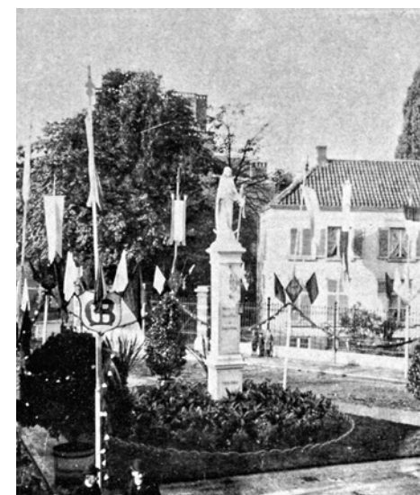
De Merodeplein 1904 met rechts woning van J. Meeüs