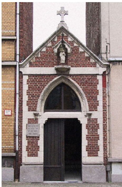
O.L. Vrouwekapelletje van Barmhartigheid (Generaal Drubbelstraat)

Misschien is het te vergezocht, maar in 1835 lagen hier wel al kasseien en in de 18de eeuw stond hier ook al een boom met een kapelletje. De cholera was in de 19de eeuw een vreselijk ziekte die duizenden slachtoffers eiste. In 1866 wordt er op de hoek van de Boomgaardstraat en de Sint-Jacobsstraat een kapelletje met een O.L.Vrouw van Barmhartigheid “op eenen boom” geplaatst. De geburen vormden een genootschap, waarvan elk lid 0,10 frank per week betaalde. Jaarlijks deden de leden een bedevaart naar Scherpenheuvel. Volgens de overlevering zou