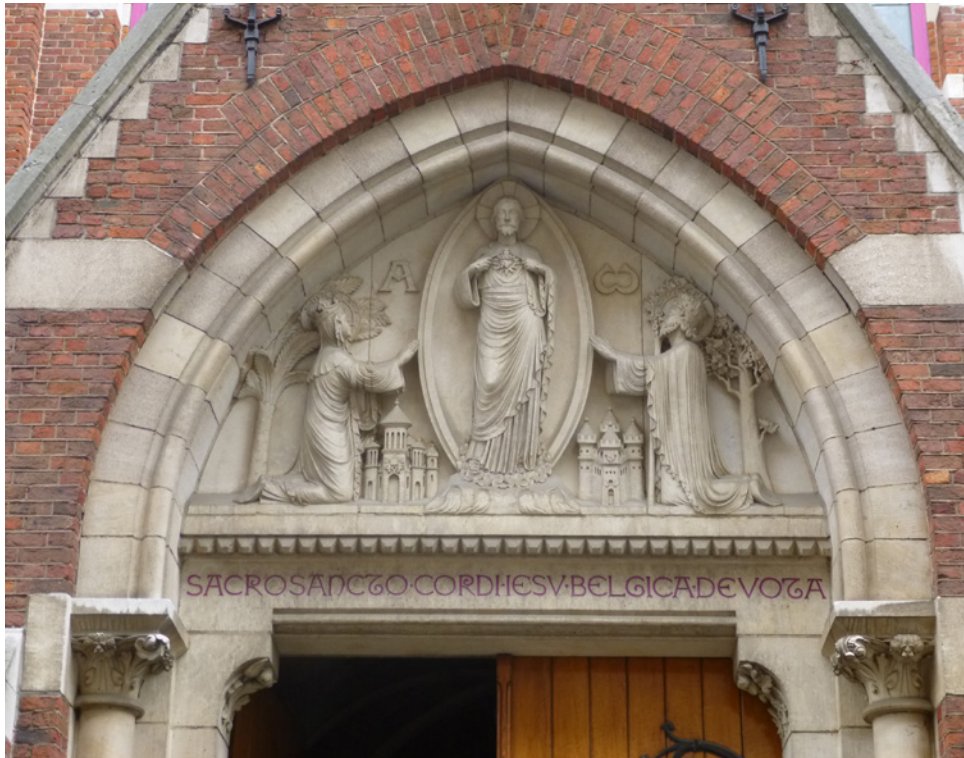
Bovenportaal van de Basiliek (De Merodelei)