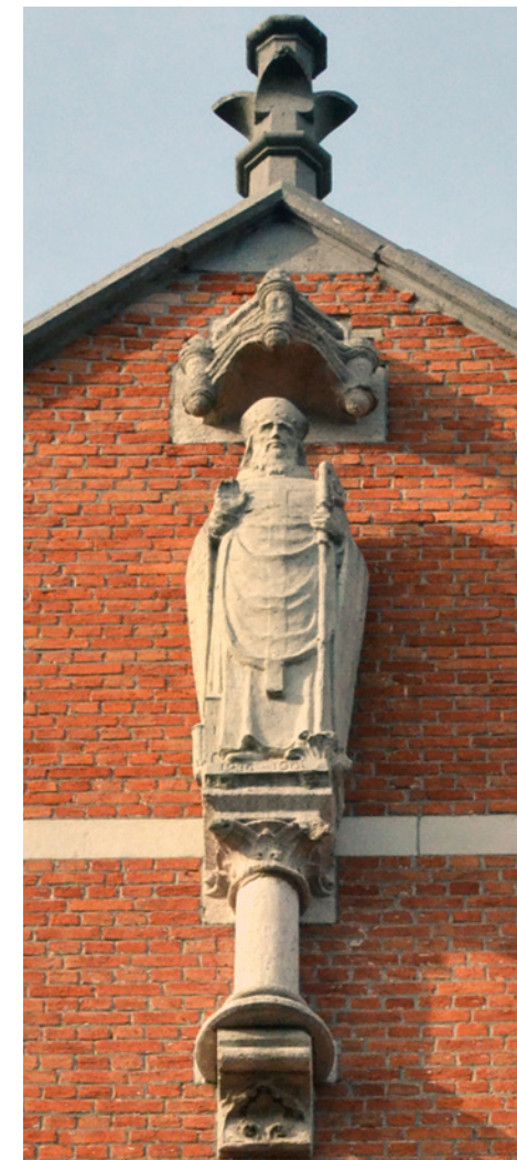
Sint-Willibrordusbeeld (Vrede - Vredestraat)

Het vroegere parochiecentrum is nu een tref-fen van ontmoeting en cultuur: De Nieuwe Vrede.