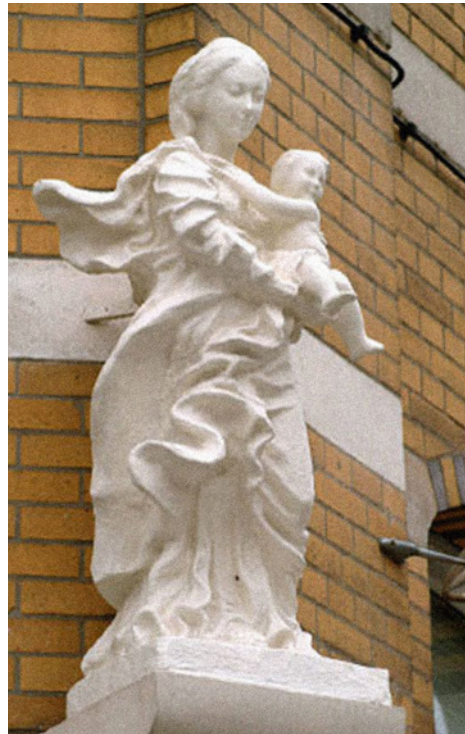
O.L.V. met kind (Mimosastraat)