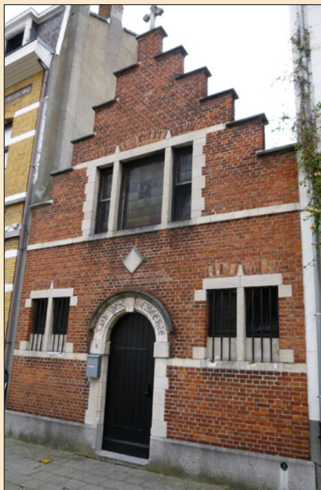
Kapel Cameliestraat 5

Momenteel is de kapel eigendom van de Egyptische-Koptische kerk van België. Kijk zeker eens naar hun website en luister naar de mooie gezangen. De Berchemse kapel is genoemd naar de evangelist Marcus (een tweede vestiging in Leuven is genoemd naar de Heilige Maagd en Apostelen). De Egyptische-Koptische kerk is gesticht in Egypte vanuit de evangelisatie van Marcus.