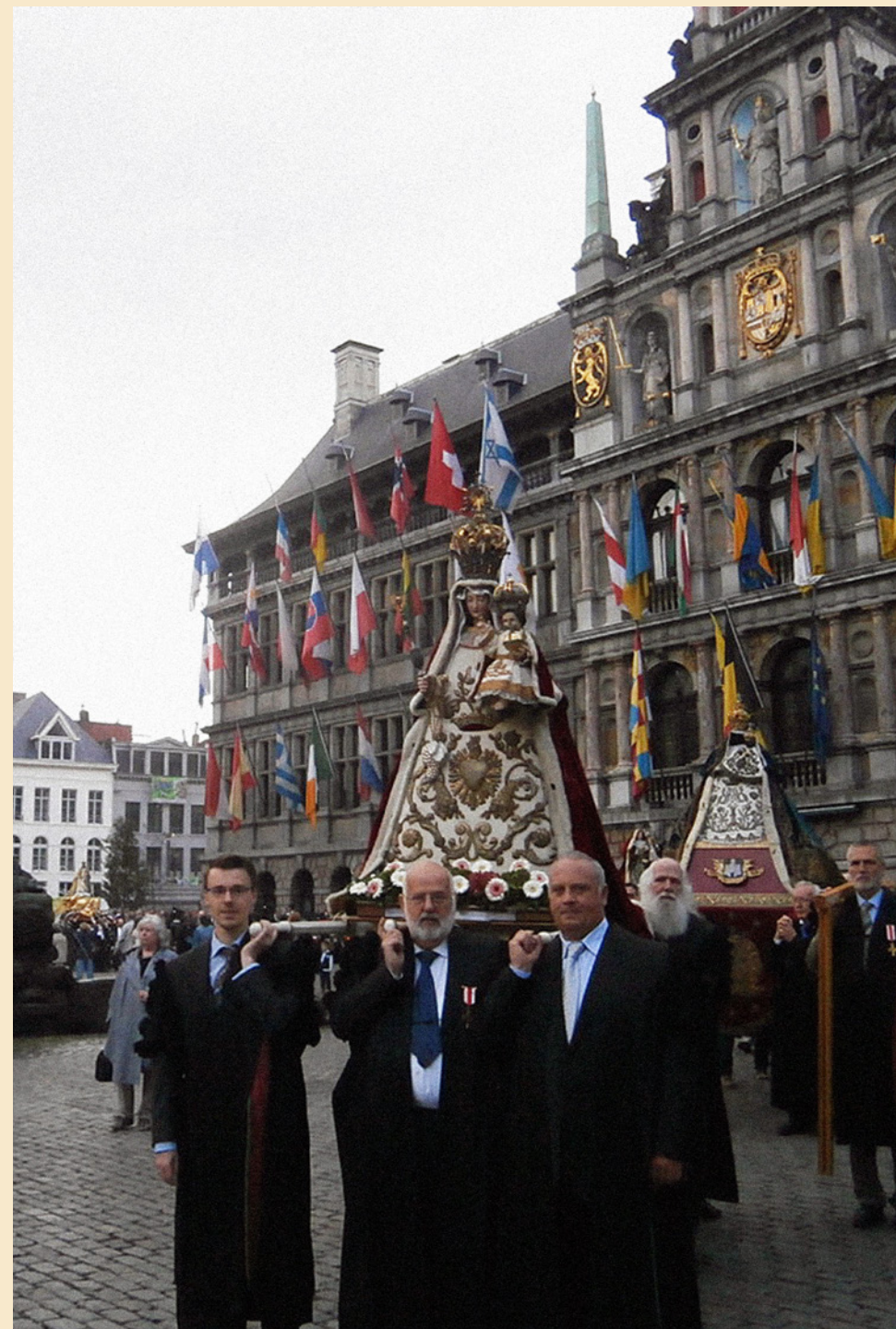
Het Berchemse Mariabeeld tijdens de Scheldewijding (2013)

vergulder en verzilveren van spiegels en inlijsten. Hij begon zijn loopbaan in het bedrijf van zijn moeder dat op ambachtelijke wijze fotopapier produceerde. Hij bleef verder studeren, leerde op eigen houtje talen en bestudeerde de vakliteratuur over fotografische procedés. In 1894 richtte hij reeds de firma Lieven Gevaert & Co op.