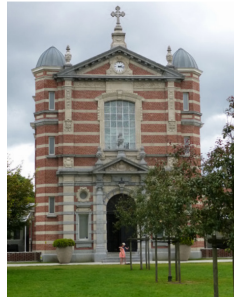
Kapel van het voormalige Militair Hospitaal (nu een restaurant)