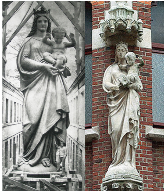
Notre-Dame de la Garde (Marseille)

Op de terugwandeling zie je in de Le Grellelei nummer 34 boven de voordeur een kopie van de beroemde marmeren zittende Madonna van Michelangelo. Het origineel kan je bewonderen in de Brugse O.L.-Vrouwekerk. Een beetje stuurs in vergelijking met de lieflijke madonna van twee huizen terug.