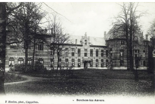
Achterzijde kasteel De Lintworm