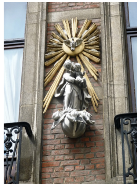
O.L. Vrouw met kind (Kardinaal Mercierlei)