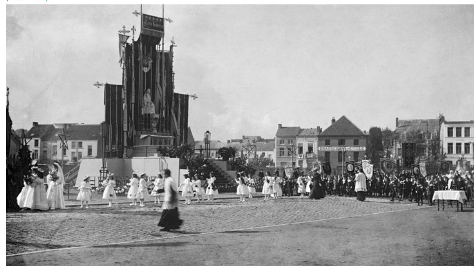
Mariahulde op het F. Van Hombeeckplein (1904)