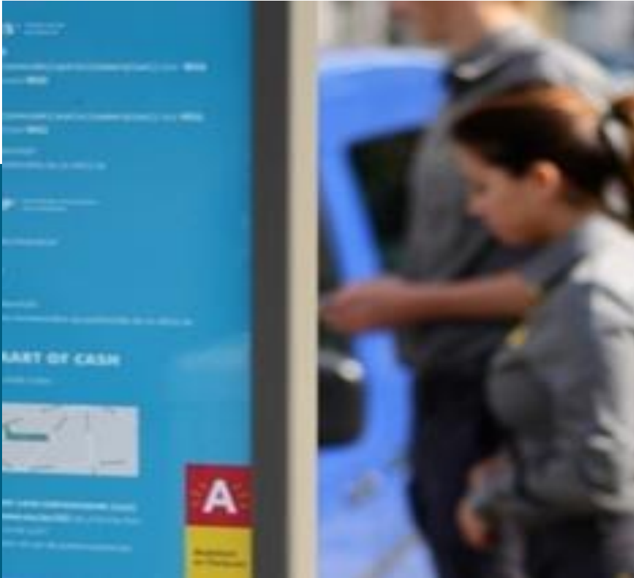
Controle op betalend parkeren → RETRIBUTIE