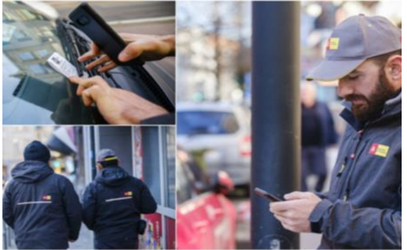
Controle op foutparkeren → GAS-boete