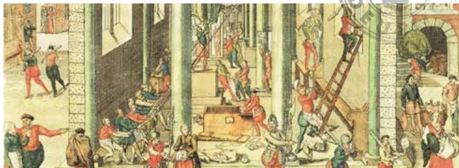
Vernieling van de Onze-Lieve-Vrouwekathedraal te Antwerpen op 20 augustus 1566 (gravure van Frans Hogenberg).