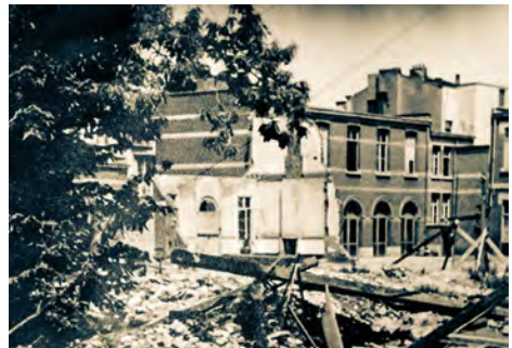
Zicht op de speelplaats van Sint-Joanna richting Ferdinand Coosemansstraat.

Op vrijdag 17 november 1944 , om 11.15 uur in de voormiddag, wordt een V2-raket vanuit een bos in Heek vlakbij Burgsteinfurt in Duitsland, afgevuurd richting Antwerpen. Na een vlucht van 210 km komt de raket, 7 minuten later, om 11.22 uur terecht in de Ferdinand Coosemansstraat. Met een gewicht van 12,5 ton en een springkop van 975 kg explosieven valt de raket tegen een snelheid van 2880 km/uur neer op het klooster. De V2 komt terecht in de keuken, in het hart van het klooster en boort zich door het gebouw tot in de grond en explodeert. Het ganse gebouwencomplex wordt