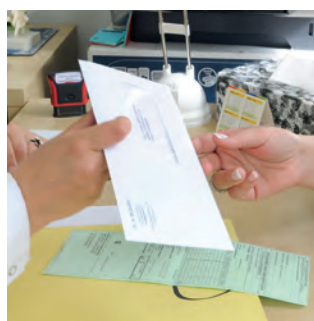
brief van de huisdokter