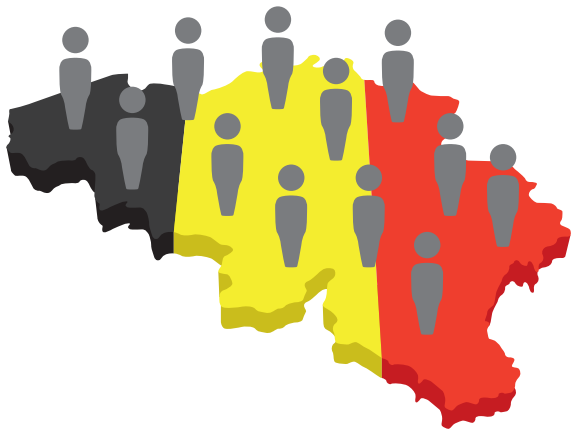
mensen in België

3 In België hebben de mensen een vaste huisdokter .