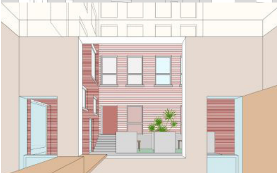
De Smet Vermeulen architecten