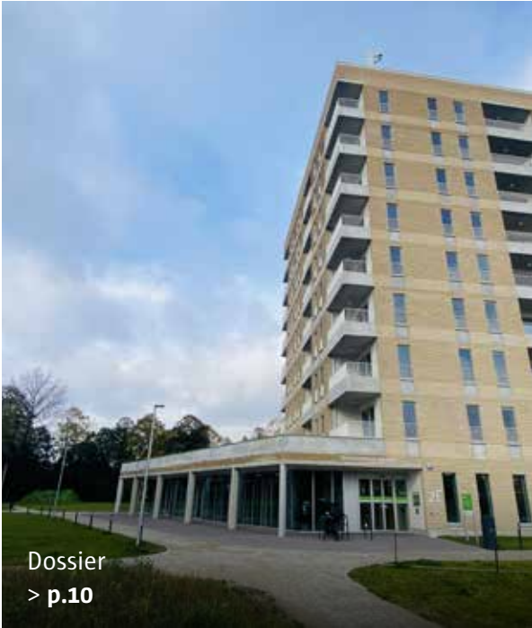
Dossier > p.10