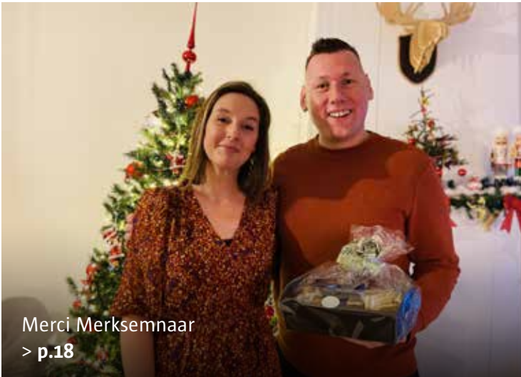
Merci Merksemnaar > p.18