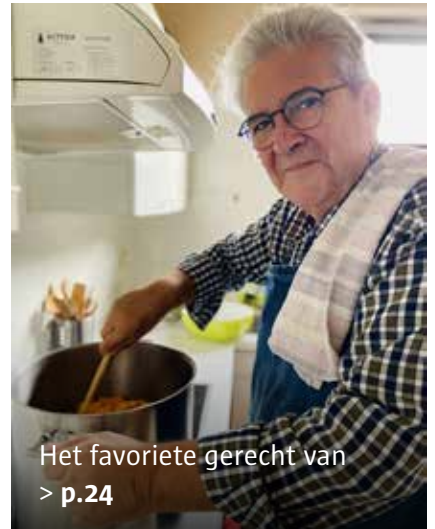
Het favoriete gerecht van > p.24