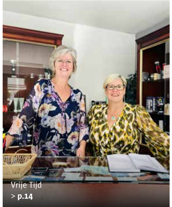
Vrije Tijd > p.14