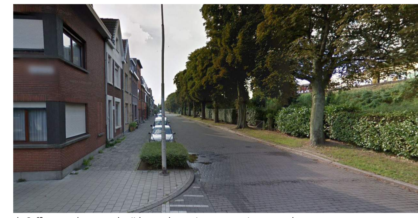
de Saffierstraat kent aan de zijde van de woningen een ruim voetpad.