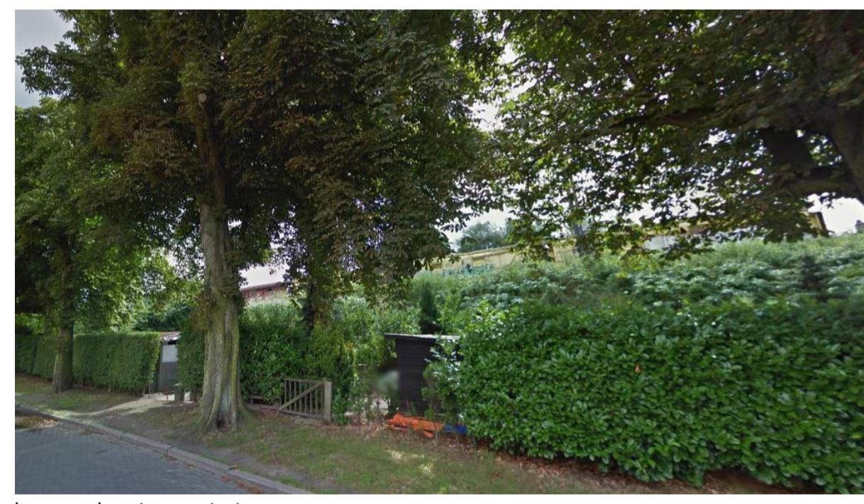
bestaande private tuinjies