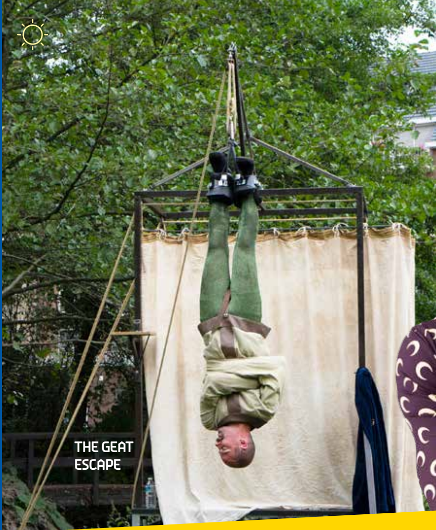
THE GREAT ESCAPE