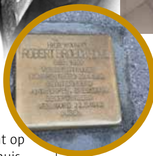
De gedenksteen van ex-schepen Robert Broeckhove

België telt al ruim 300 struikelstenen. Dat zijn kleine plaatjes die in het voetpad worden aangebracht. Je vindt ze voor woningen waar mensen woonden die tijdens de Tweede Wereldoorlog werden verdreven, gedeporteerd of vermoord door de nazi's. Sinds april heeft ook Wilrijk twee struikelstenen die hulde brengen aan Wilrijkenaren die hun verzet tijdens de Tweede Wereldoorlog met de dood bekocht hebben.