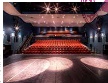
@ Walter Saenen