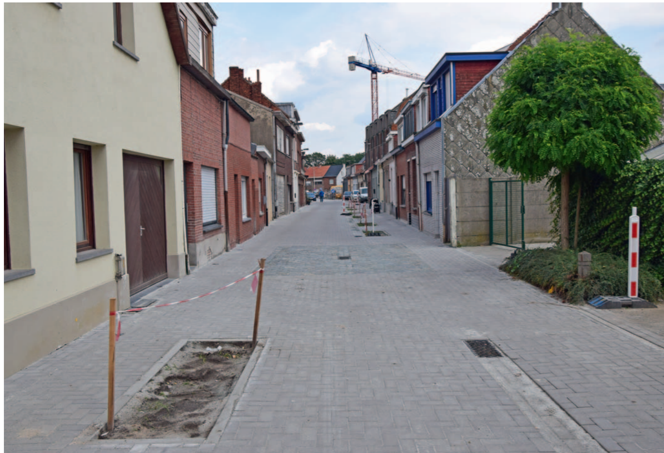
De Blarenstraat eind september 2017